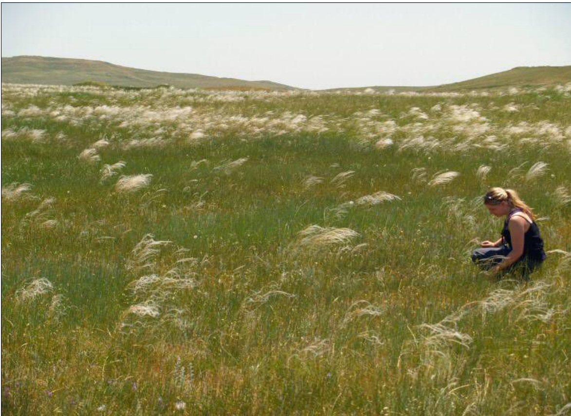
Im Steppengebiet bei David Gareджи