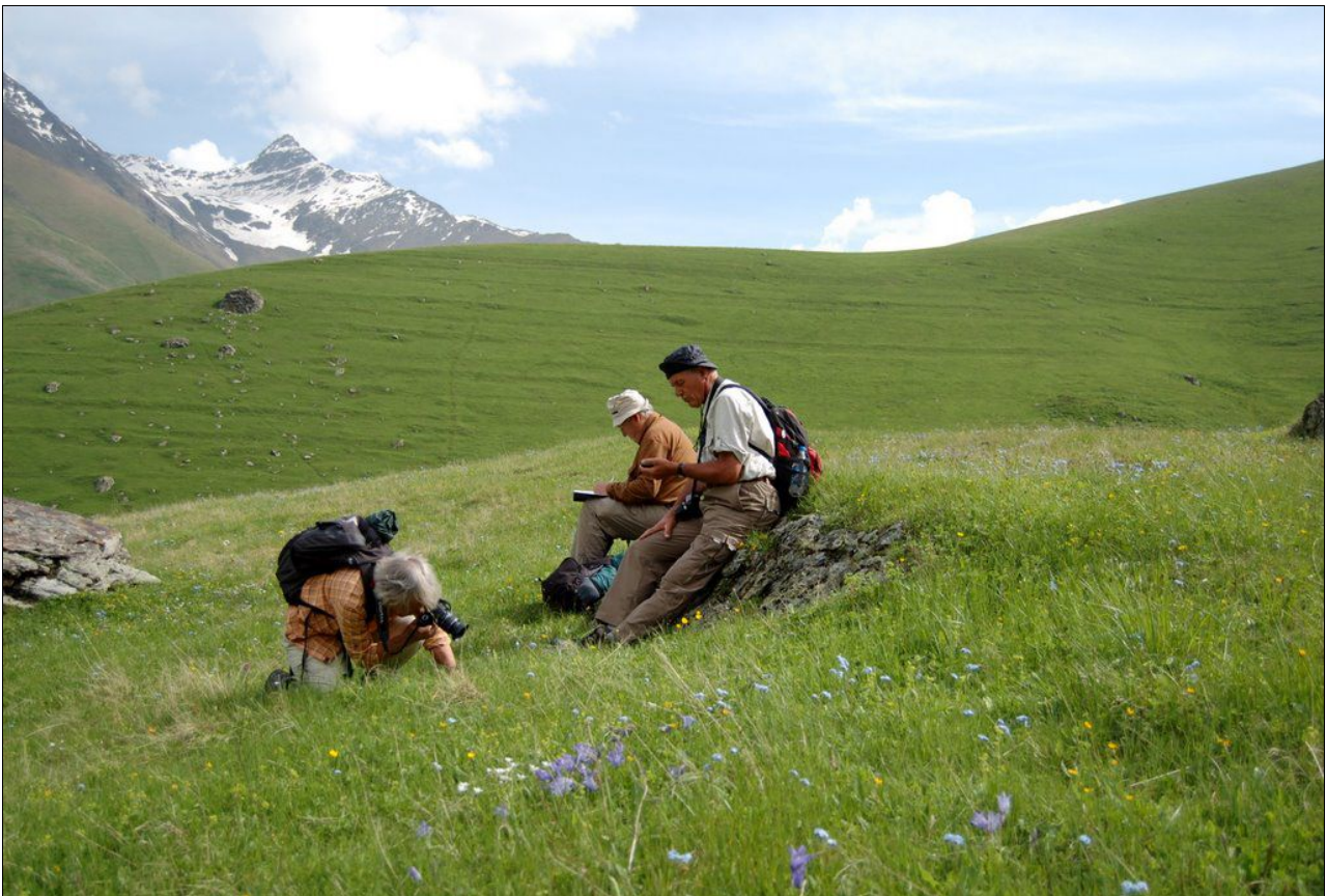
Bei Dshuta, Großer Kaukasus